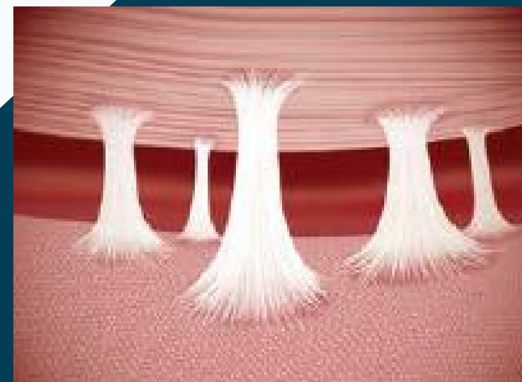
Fibroscitos em estágio avançado de adesão