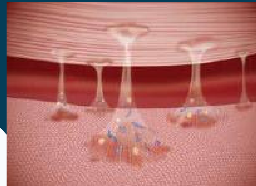
Tecido preparado com intervenção de fibroblasto

Em cirurgia espinal aderências pode causar dor recorrente nas costas ou pernas e gerar ao paciente limitações físicas que tornam necessária uma nova intervenção.