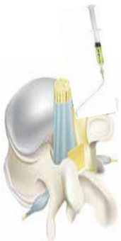
Adcon® Gel envolve a raiz nervosa, dura-máter e os ligamentos minimizando a adesão

Como resultado o Adcon Gel causa uma melhor reabilitação do paciente, redução da dor recorrente e diminuição do número de reoperações como resultado de tais aderências.