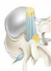
Área vertebral pós-operatória não tratada mostrando aderências em torno da área operada de dura, raiz nervosa, ligamento e tecidos moles.