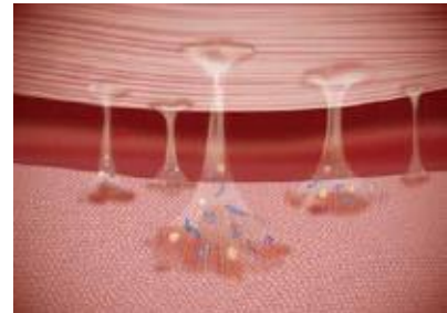
Tecidos separados com intervenção de fibroblastos.

As aderências são uma complicação grave e frequente, normalmente ocorrem no local do procedimento cirúrgico, se desenvolvem durante os primeiros 3 ou 5 dias após a cirurgia e pode requerer a reospitalização e intervenção cirúrgica. Em cirurgia espinal aderências pode causar dor recorrente nas costas ou pernas e gerar ao paciente limitações físicas que tornam necessária uma nova intervenção, conhecida como síndrome de cirurgia espinal.