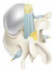
Área vertebral intra-operatória mostrando raízes nervosas livres de adesão, dura-máter e ligamento