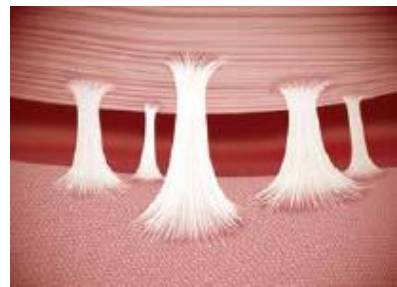
Fibroblastos em estágio avançado de adesão.